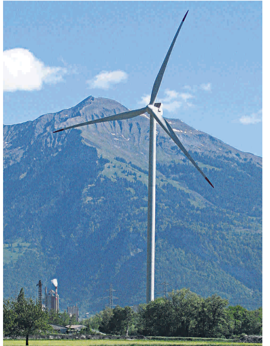
Wissenschaftliche «Suche»: Mit der am NTB entwickelten Simulation wird in einem Projekt grossräumig nach geeigneten Standorten für Windturbinen gesucht (hier jene von Calanda Wind im bündnerischen Haldenstein).

Die Vorstudie wurde unter anderem ermöglicht durch den regionalen Energiepool Rii-Seez Power, die Bundesförderagentur für Technologie und Innovation (KTI), die Solargenossen-